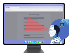
Unsere KI analysiert